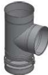
Vista 3D Tipo B