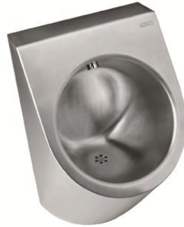
SNU108C - Acabado brillante SNU108CS – Acabado satinado